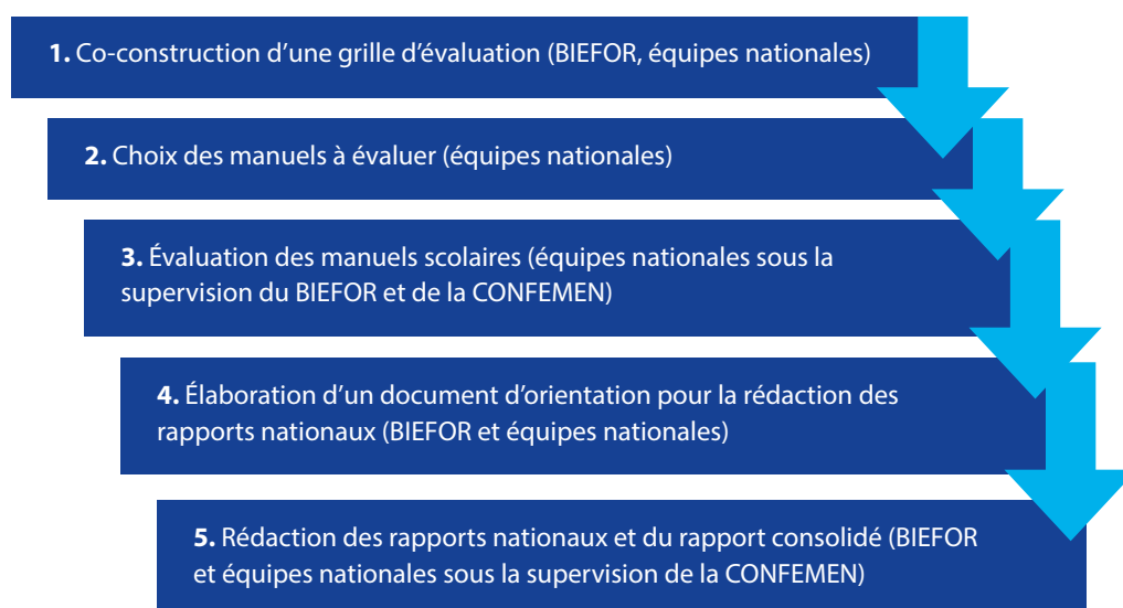
Figure 5 : phases de l'évaluation de la qualité des manuels scolaires

La démarche choisie pour cette évaluation se structure en 5 phases indiquées dans la figure 5.