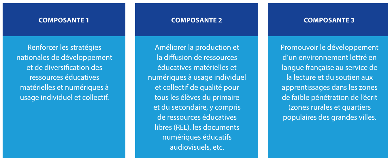
Figure 2 : composantes du projet « ressources éducatives »

Par ailleurs, malgré l'émergence des ressources numériques, le manuel scolaire demeure la ressource éducative la plus utilisée par les enseignants et par les élèves, en particulier dans les pays d'Afrique subsaharienne (Gerard & Roegiers, 1993). Ainsi, selon (Benavot & Jere, 2016), les enseignants ont recours aux manuels comme moyen d'enseignement dans 70 % à 95 % du temps de classe. Et ce rôle central ne devrait pas connaître d'évolution notable dans les années à venir en Afrique subsaharienne francophone (Obono Mba & Ngamba Engohang, 2018).