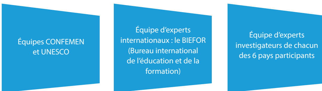
Figure 4 : parties prenantes de l'évaluation de la qualité des manuels scolaires

Trois principaux types de parties prenantes ont été impliqués dans la mise en œuvre de l'évaluation de la qualité des manuels scolaires. Ces types de parties prenantes sont indiqués dans la figure 4.